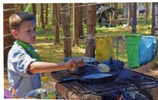
fol. Grzegorz Gielert